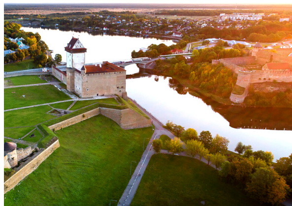
Вид на Нарвский замок, Ивангородскую крепость и речные променады

Дальнейшее строительство променадов по обе стороны реки Нарвы и мероприятия по их использованию и привлечению могут быть реализованы в рамках общего проекта, потому что только в этом случае реализация проекта будет способствовать максимальной синергии и наилучшему вкладу в достижение цели проекта, тем самым делая приграничное сотрудничество между двумя городами более продуктивным и эффективным.