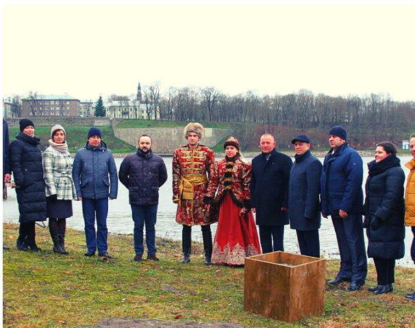
Закладка краеугольного камня в Ивангороде

19 ноября 2020 г. заложили краеугольный камень на месте, где совсем скоро начнутся работы по продлению речного ивангородского променада.